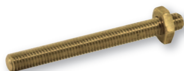
PRN360 Perno UNI 1707 M3x60