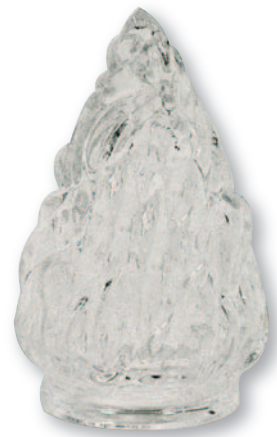
F 0553 Fiamma vetro media Ø cm 5