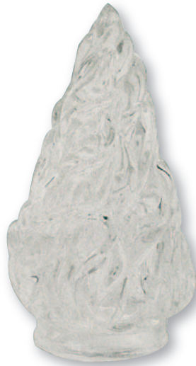
F 0552 Fiamma vetro grande Ø cm 6