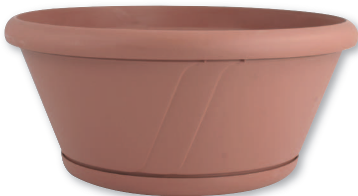
BP 056 Bossolo in plastica