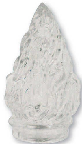
F 0557 Fiamma vetro media baionetta