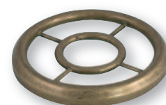
GD 0271 Griglia