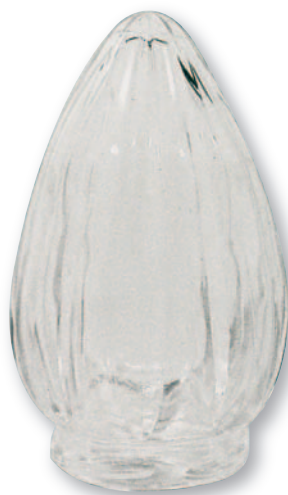
FM 001 Fiamma vetro grande baionetta