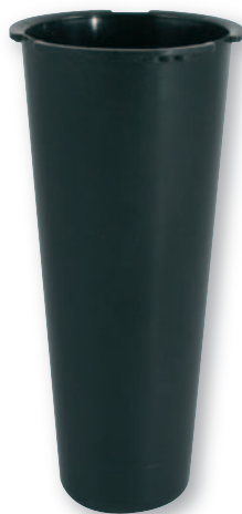
BP 024 Bossolo in plastica