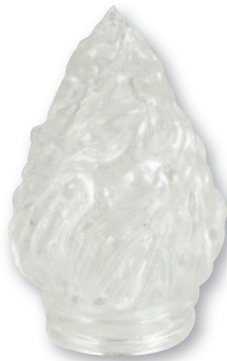
F 0555 Fiamma vetro media Ø cm 4