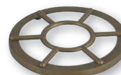
GD 0274 Griglia