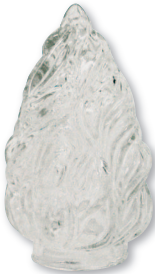
F 0551 Fiamma vetro gigante Ø cm 8