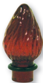
F 0560 Fiamma vetro micro rossa