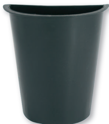
IP 0617 Interno in plastica