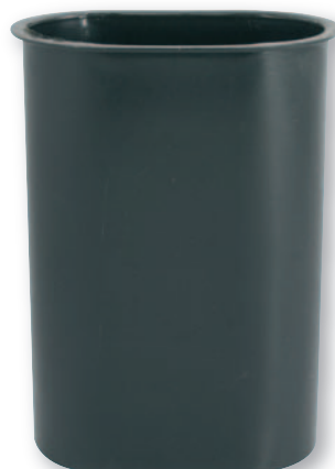
IP 071 Interno in plastica