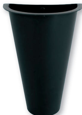
IP 0145 Interno in plastica