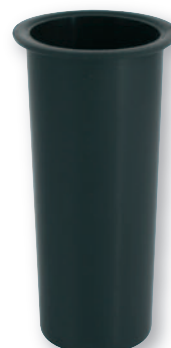
BP 054 Bossolo in plastica