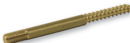
PRNL550 Perno per legno M5x50