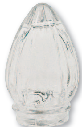
FM 002 Fiamma vetro media baionetta