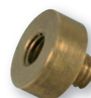
DST146M6T DST148M6T 6 mm. 8 mm. Distanziale