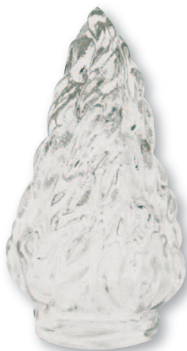
F 0558 Fiamma vetro grande baionetta