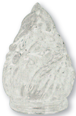
F 0554 Fiamma vetro mignon Ø cm 4