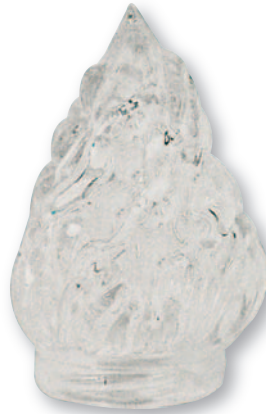
F 0556 Fiamma vetro mignon baionetta