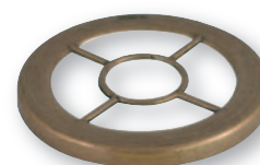
GD 0257 Griglia