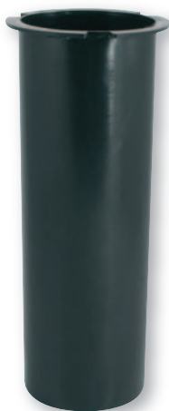
BP 052 Bossolo in plastica