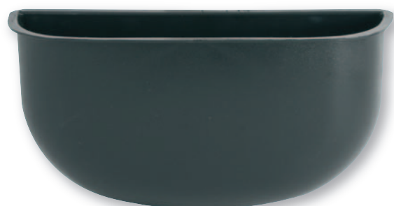
IP 0144 Interno in plastica