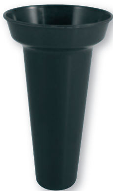
BP 01 Bossolo in plastica