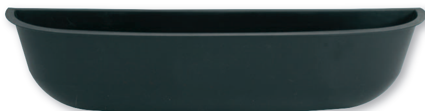
IP 0146 Interno in plastica