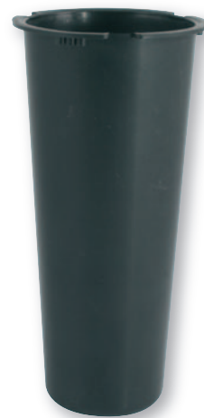
BP 028 Bossolo in plastica